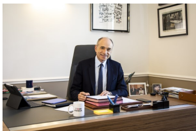
Jean-François Copé Ancien Ministre, Maire de Meaux, Président du Pays de Meaux