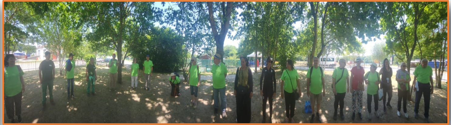
Meaux Miniature avec les bénévoles